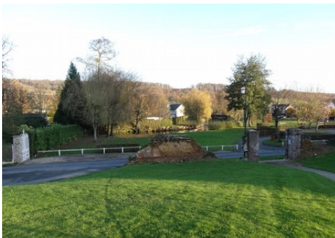
La vue vers l'Andelle depuis le manoir

Les avis seront cohérents avec ceux émis ces dernières années, à savoir : pas de maisons à volume compliqué (type V, W, Y, ou Z), pentes à 45° pour les volumes principaux, ardoise ou tuile plate de teinte brun vieilli, à 20u/m 2 , avec un débord de toiture de 20cm, enduit de teinte beige clair avec modénatures (au choix : chaînages, encadrement de fenêtres, soubassement, colombage...). *Voir les autres fiches.