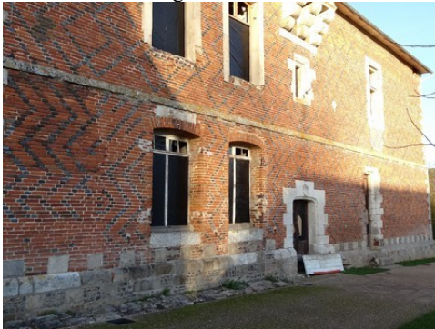
La façade sud (vue proche)