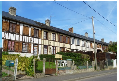
Des maisons ouvrières à pans de bois