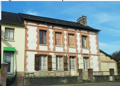
Une maison avec enduit, briques, ardoises