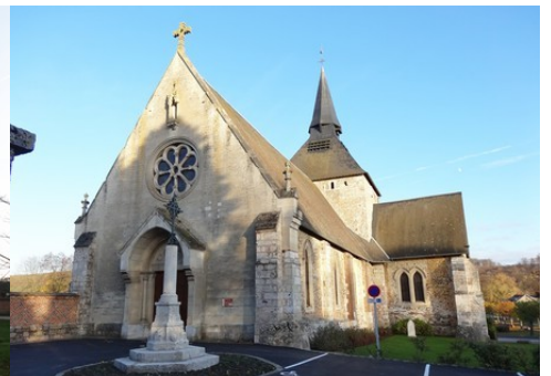
Le socle de croix et l'église (inscrits MH)