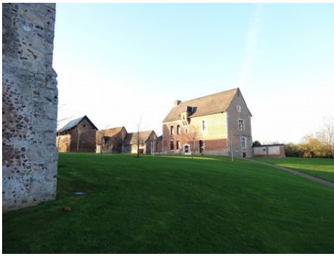
Le manoir vu de l'église