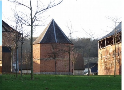
Le colombier octogonal

Pour la zone en rose foncé dans le périmètre de 500m