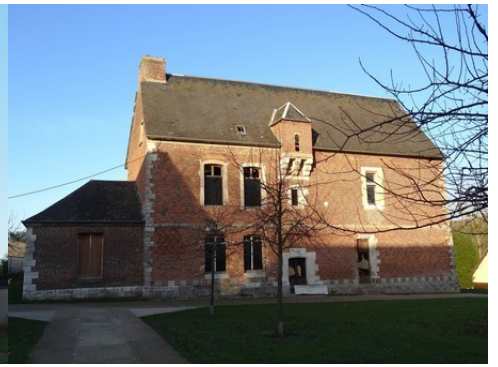
La façade sud (vue d'ensemble)