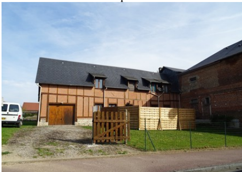
L'usage récent de briques et pans de bois