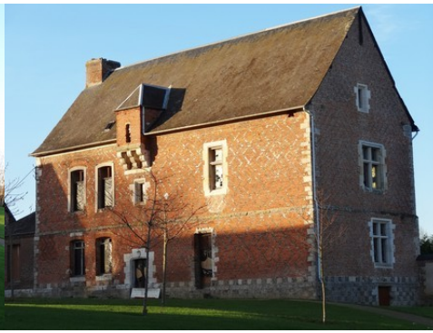
L'angle sud-est du manoir