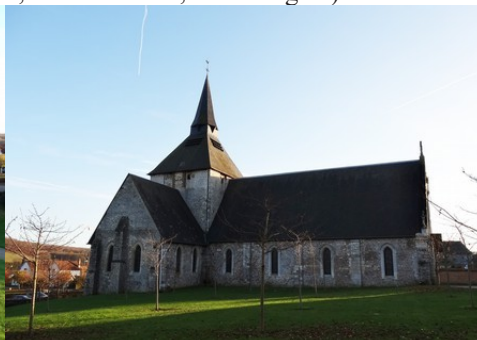
L'église Saint-Etienne depuis le manoir